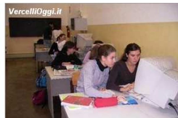
Studenti del Cavour

Gli Istituti Tecnici e Professionali si sono confermati, per l'anno scolastico 2009-2010, la prima scelta degli studenti nell'area geografica del Nord-Ovest: il 55% degli alunni iscritti alla Scuola secondaria ha infatti scelto la formazione tecnico-professionale. La scelta dei giovani è in perfetta linea con le necessità del nostro sistema produttivo poiché anche in un periodo di crisi economica, come attesta l'indagine Excelsior del 2008, il mercato del lavoro ha confermato la richiesta di giovani con una solida preparazione in ambito tecnico e professionale. I 315 Istituti operanti nell'area del Nord-Ovest sono quindi consapevoli dell'importante ruolo formativo che stanno svolgendo e si sentono, a ragione, pronti a recepire le nuove direttive ministeriali atte ad agevolare un crescente contatto tra scuola e realtà lavorative. Questi i temi che verranno affrontati ed approfonditi nel Seminario di studio "Una classifica non basta! Gli istituti tecnico/professionali e i cambiamenti dell'economia e del mercato del lavoro. Nuovi corsi e percorsi" che si terrà a Vercelli, presso l'Istituto di Istruzione Superiore "C.Cavour", Corso Italia 42, il giorno 7 aprile, dalle ore 8.45 alle ore 10.45. Aprirà il dibattito il dottor Adriano Moraglio giornalista de "Il Sole 24 ORE"; animeranno la discussione il dott. Rocco Casella, funzionario responsabile del Centro Studi della Camera di Commercio di Vercelli ed il dott. Stefano Inzaghi dell'Unione Industriale di Vercelli e della Valsesia.